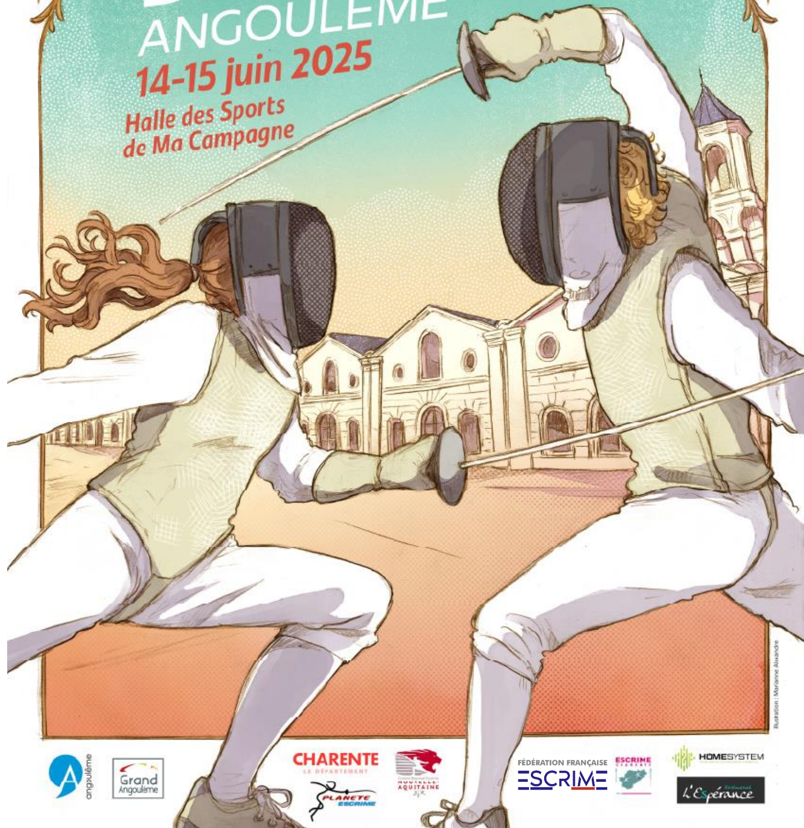
Illustration : Myrianne Alexandre

14-15 juin 2025 Halle des Sports de Ma Campagne